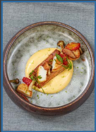
5. Buikspek sousvide gegaard 30801000