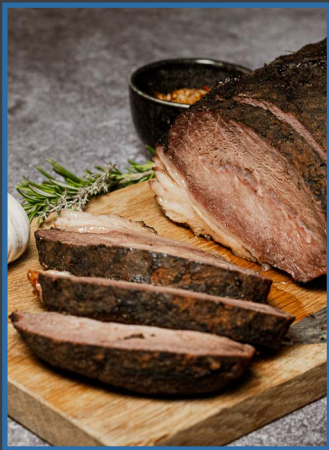
6. Rundersucade grain-fed sousvide gegaard 30316980