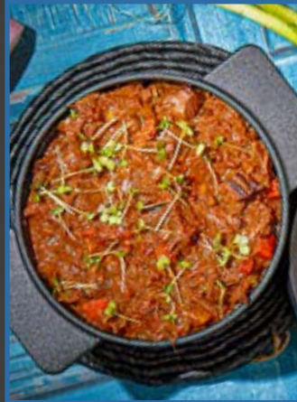
2. Runderstoof sousvide gegaard 30806550