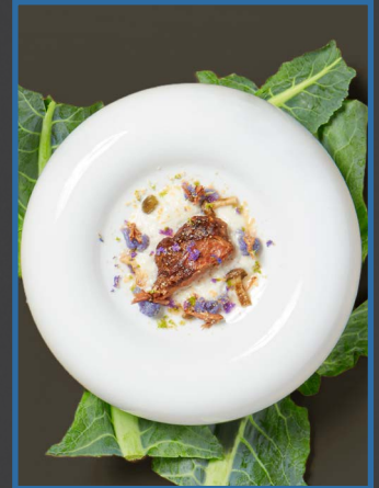
4. Runderwang sousvide gegaard 30317450