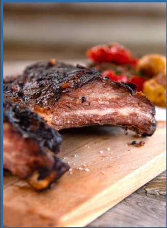
1. Beef back ribs sousvide gegaard 30806320