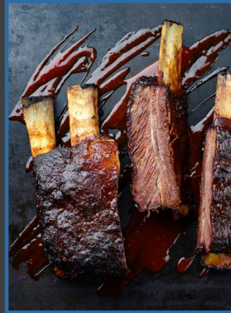
3. Beef shortribs sousvide gegaard 30806340