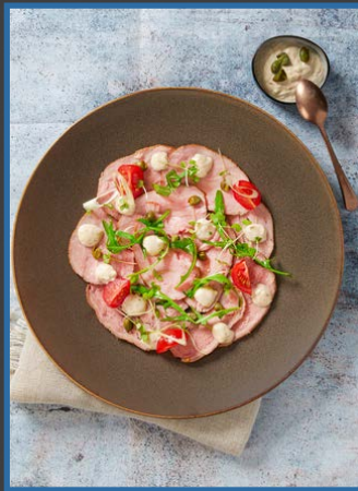
7. Kalfsmuis ● sousvide gegaard 30806540